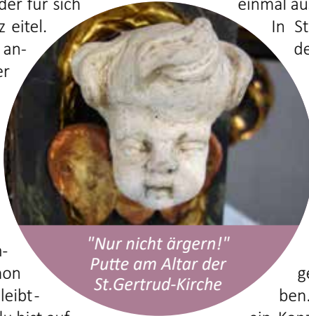
"Nur nicht ärgern!" Putte am Altar der St. Gertrud-Kirche

Das kleine Predigerbuch, aus dem unsere Überschrift stammt, hat es nicht leicht gehabt, in die Bibel hineinzukommen. Den einen war es zu weltlich, den anderen zu abgeklärt. Und schaut man hinein, so merkt man auch, warum das so ist. Es handelt sich um die Lebensbetrachtung eines in die Jahre gekommenen Menschen, der für sich feststellt: »Es ist alles ganz eitel. Ein Geschlecht kommt, ein anderes vergeht; die Erde aber bleibt immer bestehen.« Es geht also um Rückschau und um den Versuch, daraus Weisheit zu ziehen. Eine zentrale Erkenntnis ist, dass letztlich nichts Bestand hat, will sagen: nichts Menschliches. Denn es wird schon daran festgehalten: Gott bleibt - nur ist er im Himmel und du bist auf der Erde. Und deshalb handelt der klug, der weiß, wann was dran ist und sich nicht das Leben zu schwer macht, ansonsten Gott die Ehre gibt und seine Gebote hält. Wie aber hilft uns das in der Gemeinde weiter? Ich denke, in einer Zeit des Umbruchs ist es erst einmal entlastend, zu sehen, dass nicht unsere Ideen, Ansprüche und Vorhaben Maßstäbe sind, sondern die schlichte Einsicht: Wir sind begrenzt, unsere Mittel sind begrenzt, unsere Zeit ist begrenzt und unsere Kräfte sind es auch. Wenn sich also demnächst auch bei uns etwas ändert, ist das nicht der Untergang des Abendlandes, sondern einfach der Tatsache geschuldet, dass wir Menschen sind. Menschen, die einsehen müssen, es gibt Grenzen und nicht