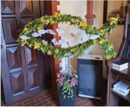
Fischdesign in Warstade