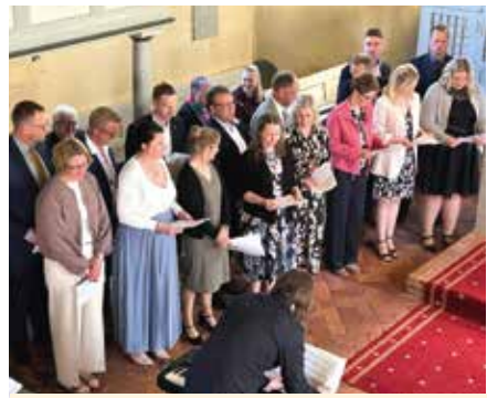
Elternchor in Basbeck