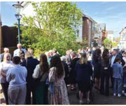
Vor der Kirche in Osten