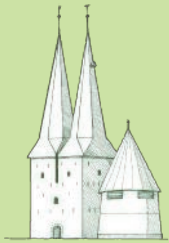
St. Nicolai Bei den Türmen 1 27478 Cuxhaven