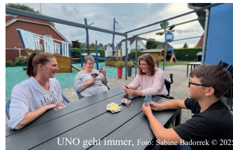
UNO geht immer, Foto: Sabine Badorrek © 2025

Tisch, vielen Spielmöglichkeiten und einer gemütlichen Sofaecke.