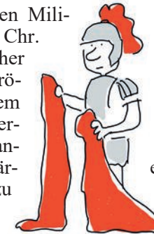
Grafik: Konstanze Ebel © 2025

Das Lied erzählt eine "Schlüsselgeschichte" aus dem Leben des Martin: Als Sohn eines römischen Militärtribunen im Jahr 316 n. Chr. geboren und selbst römischer Offizier, begegnet er in der römischen Provinz Gallien einem frierenden Bettler und zerschneidet seinen Soldatenmantel, um dem Bettler ein wärmendes Kleidungsstück zu verschaffen.