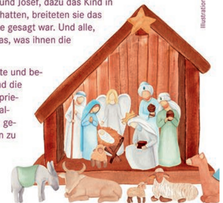
Illustrationen: S. Yanyeva