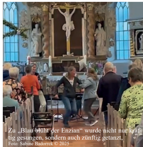
Zu „Blau blüht der Enzian“ wurde nicht nur kräf- tig gesungen, sondern auch zünftig getanzt.

den. Ja, so lebendig und fröhlich, aber auch so ruhig und nachdenklich kann es in einem Gotteshaus zugehen!