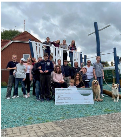
Kinder und Jugendliche sowie Mitarbeitende beim Kinderhospiz Cuxhaven-Bremerhaven freuen sich über die Kollekte, die beim diesjährigen Konfirmationsgottesdienst in Groden gesammelt und als Spende übergeben wurde.

Ein häufiges Missverständnis ist, dass im Kinderhospiz Kinder sterben würden. Das ist nicht der Fall. Das Kinderhospiz ist ein besonderer Ort, an dem schwerkranke Kinder und ihre Familien Unterstützung, Entlastung und vor allem Menschlichkeit erfahren. Es handelt sich dabei nicht um ein Krankenhaus, sondern um eine Einrichtung, in der die Kinder trotz ihrer schweren Krankheit einfach Kind sein dürfen.