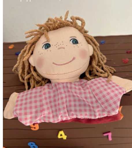
Handpuppe Mathilde

Passend dazu erzählte die Handpuppe Mathilde über ihre Schatzkiste, in der sich auch ein Stück Radierknete befand. Wie im Gottesdienst gezeigt wurde, lassen sich daraus viele wunderbare Dinge kneten, z.B. eine Kugel, ein Hut, eine „1“ oder ein Herz. Aber nicht nur das! Mit der Radierknete kann man auch etwas wegradieren und noch mal ganz von vorne anfangen. Das ist ebenfalls wunderbar!