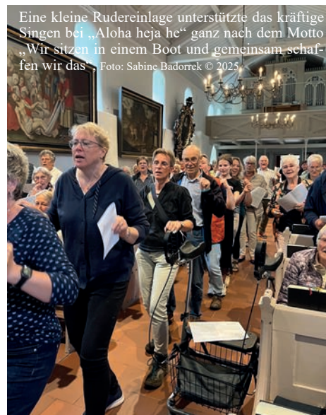
Eine kleine Rudereinlage unterstützte das kräftige Singen bei „Aloha heja he“ ganz nach dem Motto „Wir sitzen in einem Boot und gemeinsam schaf- fen wir das“.

Zu diesem Lied wurde in der Kirche kräftig gerudert und gesungen! Und das beim 3. Schlagersingen in Gro-