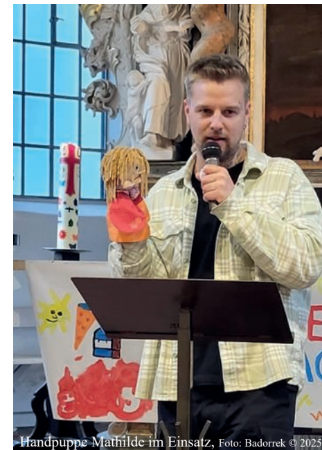
Handpuppe Mathilde im Einsatz, Foto: Badorrek © 2025

Passend dazu erzählte die Handpuppe Mathilde über ihre Schatzkiste, in der sich auch ein Stück Radierknete befand. Wie im Gottesdienst gezeigt wurde, lassen sich daraus viele wunderbare Dinge kneten, z.B. eine Kugel, ein Hut, eine „1“ oder ein Herz. Aber nicht nur das! Mit der Radierknete kann man auch etwas wegradieren und noch mal ganz von vorne anfangen. Das ist ebenfalls wunderbar!