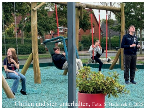
Chillen und sich unterhalten, Foto: S. Badorrek © 2025

bensfreude der Kinder im Vordergrund. Die Kinder, die im Hospiz betreut werden, sind nicht akut sterbenskrank. Es handelt sich um sogenannte lebensverkürzend erkrankte Kinder. Das bedeutet, dass ihre Erkrankung nicht heilbar ist und ihre Lebenserwartung deutlich verkürzt ist. Trotzdem liegt der Fokus im Hospiz auf dem Leben und nicht auf dem Sterben.